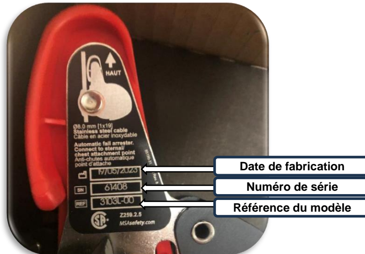
Figure 2: Données d'inspection GTFA

MSA Corporate Center 1000 Cranberry Woods Drive Cranberry Township, PA 16066 800.MSA.2222 www.MSAafety.com