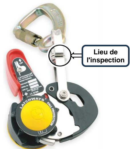
Figure 1: GTFA